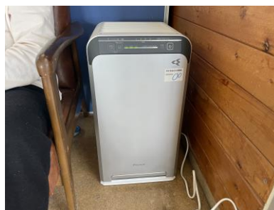
空気清浄機を購入し、利用者が主に過ごす食堂に設置。