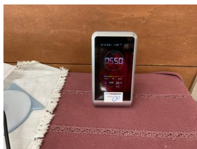
二酸化炭素計を購入。作業場に設置。