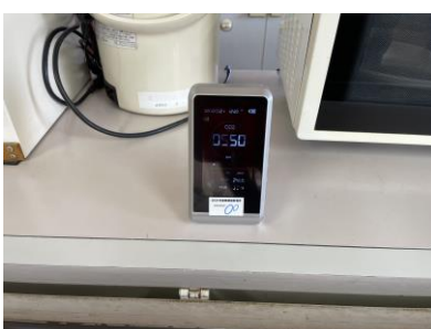
二酸化炭素計を購入。旧館に設置。