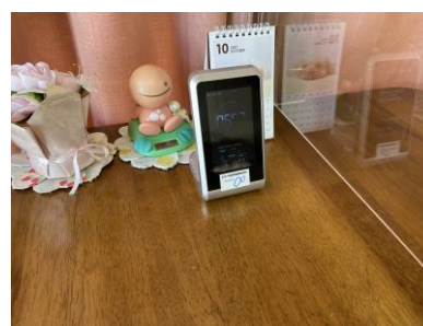
二酸化炭素計を購入。旧館事務所に設置。