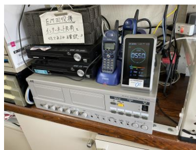
二酸化炭素計を購入。事務所に設置。