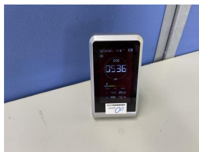
二酸化炭素計を購入。新館に設置。