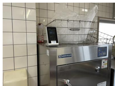
二酸化炭素計を購入。厨房に設置。