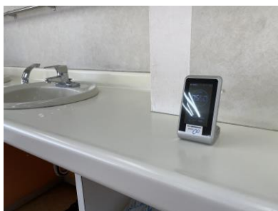
二酸化炭素計を購入。食堂に設置。