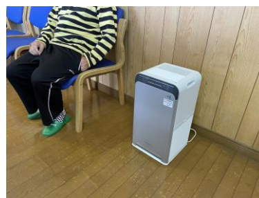
空気清浄機を購入利用者が主に過ごす旧館に設置。