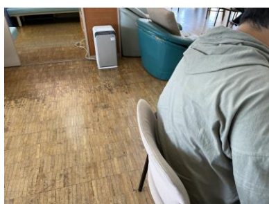
空気清浄機を購入利用者が主に過ごす作業場に設置。