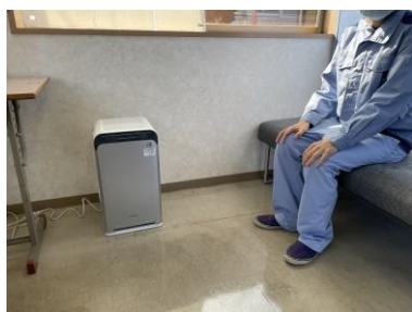
空気清浄機を購入利用者が主に過ごす新館に設置。

新型コロナウイルス感染対策として、空気清浄機4台・二酸化炭素センサー7台・サーモカメラ2台・テント2張を購入